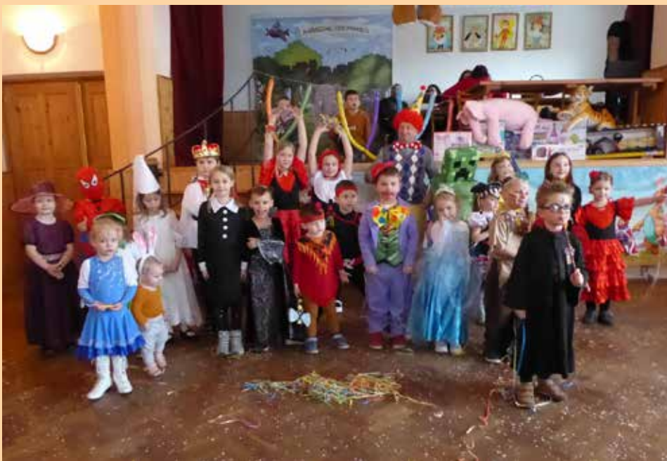
Dětský karneval 9. března