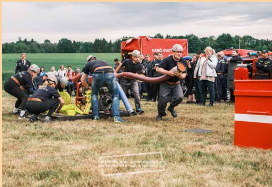
Soutěž hasičů v Loučkách