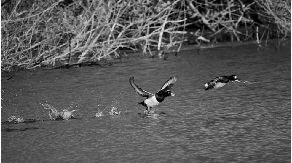
Polák chocholačka, samec – samice

Každý zná nějaký druh ptáka, ale málokdo si uvědomuje, jak často a kolik jich vidáme ve všedním životě. Ano, snad každý zná sýkoru nebo vrabce, kosa či čápa, ale co ti vzácnější méně znáší? Tak si například vezměte, kolik druhů můžeme vidět cestou do obchodu. Zvonka zeleného, drozda kvíčalu, sýkoru koňadru nebo modřinku, holuba hřivnáče nebo možná strakapouda velkého. Tyto druhy ano, ale asi těžko uvidím vodouše kropenatého, husici nilskou nebo poláka chocholačku na obecním rybníku.