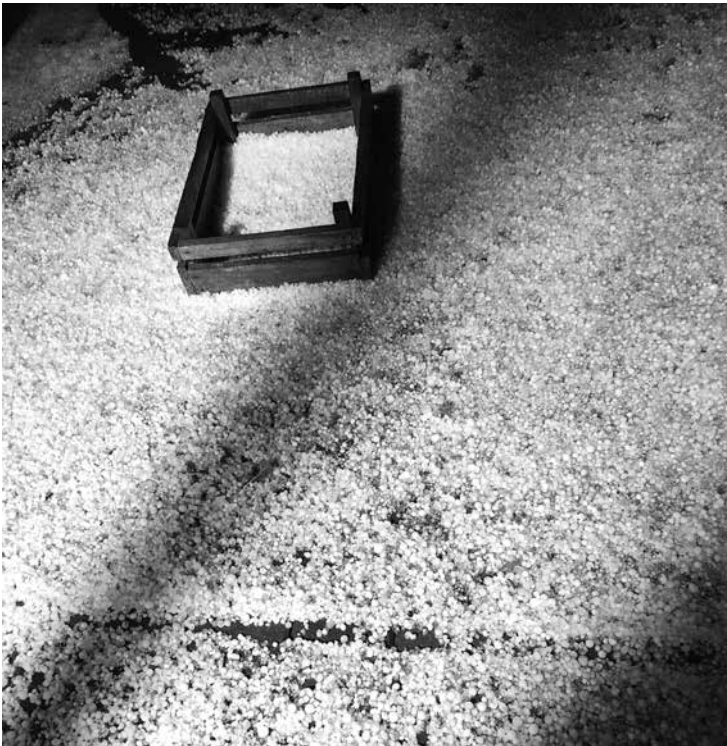
Kroupy 19. května